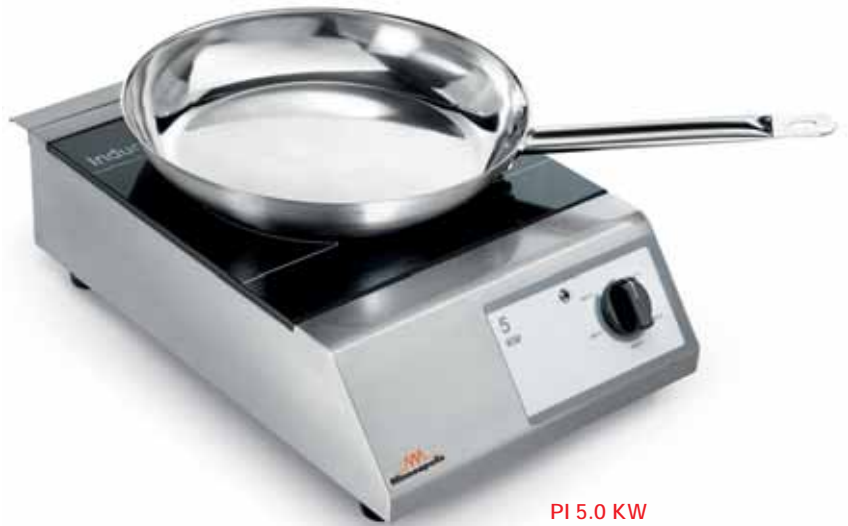
PI 5.0 KW