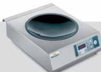
IH 35 WOK