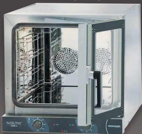
PORTA A BANDIERA (opzionale) HINGED DOOR (optional)