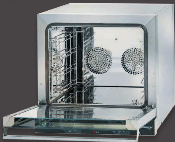
PORTA A RIBALTA (standard) FOLDING DOOR (standard)